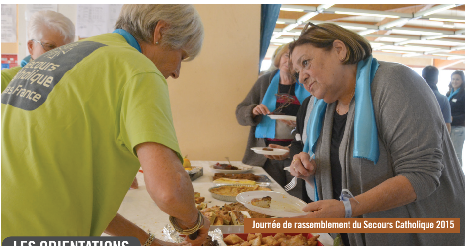
Journée de rassemblement du Secours Catholique 2015