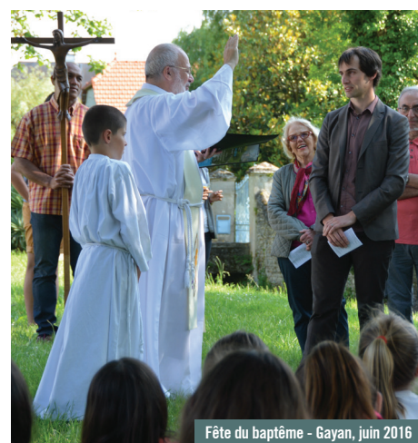
Fête du baptême - Gayan, juin 2016

Leur ministère est indispensable pour que l'Église n'oublie jamais qu'elle se reçoit du Christ, qu'elle trouve sa vie en lui, qu'elle marche à sa suite. Par son activité pastorale, par ses initiatives, par toute sa vie consacrée à Dieu, par sa prière, par sa bonté, par le don de lui-même dans le service, un prêtre manifeste sacramentellement la présence du Christ ; il est le signe du Christ présent, le bon berger qui connaît ses brebis et que ses brebis connaissent.