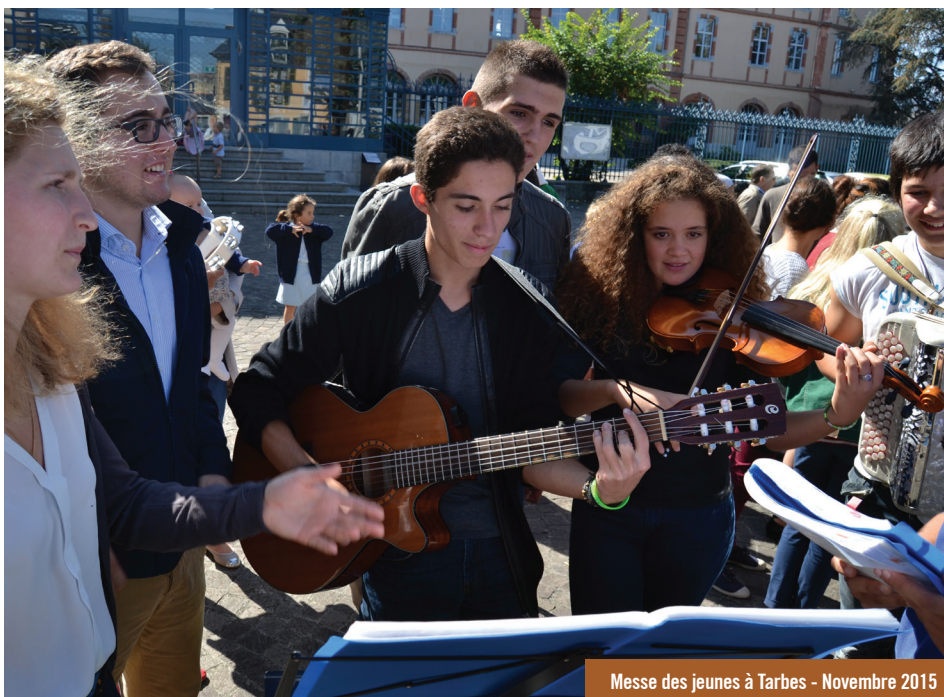
Messe des jeunes à Tarbes - Novembre 2015

Entrer en dialogue avec ceux que nous ne connaissons pas et qui ne nous ressemblent pas, pour les comprendre, les