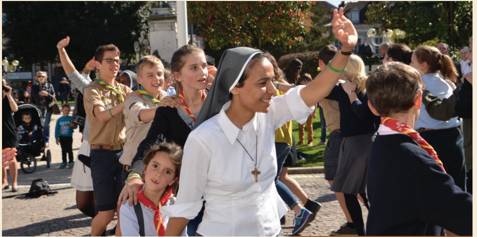
150 ans des Sœurs de Saint-Frai - avril 2016

En témoignant d'une vie de disciple consacrée dans la chasteté, l'obéissance et la pauvreté, en vivant en communauté, les religieuses et les religieux nous encouragent à prendre au sérieux notre appel à suivre le Christ. Notre Eglise diocésaine a besoin des religieux et religieuses. Je rends grâce au Seigneur pour les vocations à la vie consacrée qui naissent dans nos familles, dans nos communautés paroissiales, dans nos mouvements. Et j'invite les jeunes à se poser honnêtement la question d'une existence entièrement donnée au Seigneur dans la prière, dans la vie communautaire, dans le service de l'Eglise et du monde. Nous avons besoin du témoignage d'hommes et de femmes qui nous parlent de la joie d'être à Dieu sans réserve.