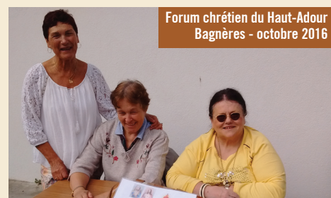
Forum chrétien du Haut-Adour Bagnères - octobre 2016

Une formation sera proposée dans le diocèse pour aider à fonder ces fraternités.