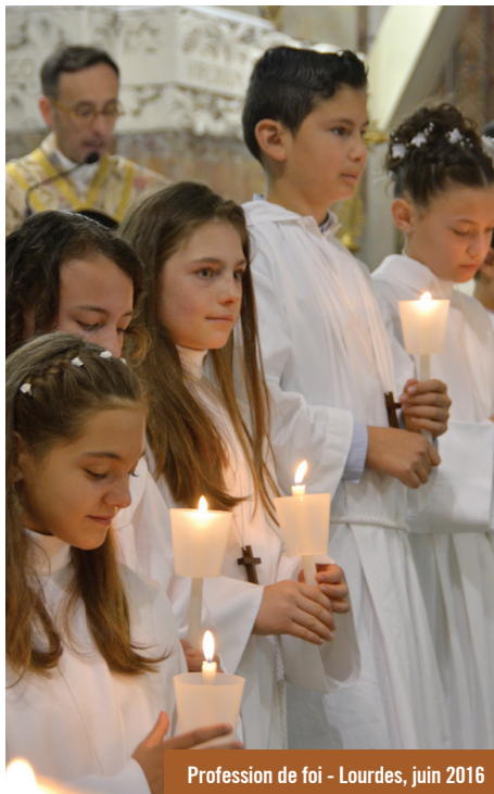
Profession de foi - Lourdes, juin 2016

Dans son fondement elle est d'abord une communauté d'Église. L'Évangile y est accueilli comme une lumière qui permet de poser un regard de foi sur les élèves qui les fréquentent, sur les projets éducatifs, sur les relations entre les personnes, sur l'organisation du travail, sur l'échec scolaire et même sur la gestion de l'établissement. L'activité pastorale n'y est pas une matière optionnelle mais elle est l'âme des activités de l'établissement et donne son sens à l'engagement de l'Église dans le système scolaire.