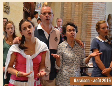
Garaison - août 2016

Une véritable solidarité doit s'établir avec toutes les personnes seules. Je pense en particulier, aux personnes qui ont perdu leur conjoint. Je pense aussi aux personnes divorcées. La logique de l'intégration doit être aussi la clé de l'accompagnement pastoral des personnes divorcées et remariées. « Non seulement ils ne doivent pas se sentir excommuniés, écrit le Pape François dans l'Exhortation Apostolique Amoris Laetitia , mais ils peuvent vivre et mûrir comme membres vivants de l'Église, la sentant comme une mère qui les accueille toujours, qui s'occupe d'eux avec beaucoup d'affection et qui les encourage sur le chemin de la vie et de l'Évangile. » ( Amoris Laetitia , 299). Nous ne devons jamais