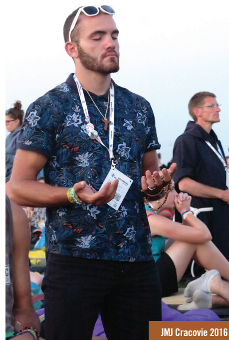
JMJ Cracovie 2016

J'invite tous les adultes à encourager les jeunes qu'ils connaissent à intégrer ces groupes ou même à constituer avec eux de nouveaux groupes.