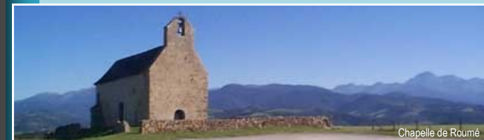
Chapelle de Roumé